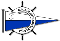
Club Náutico Alicante Costa Blanca