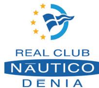
Real Club Náutico Denia