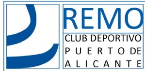
Club Deportivo Puerto de Alicante