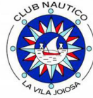
Club Náutico La Vilajoiosa