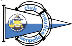
Club Náutico de Campello