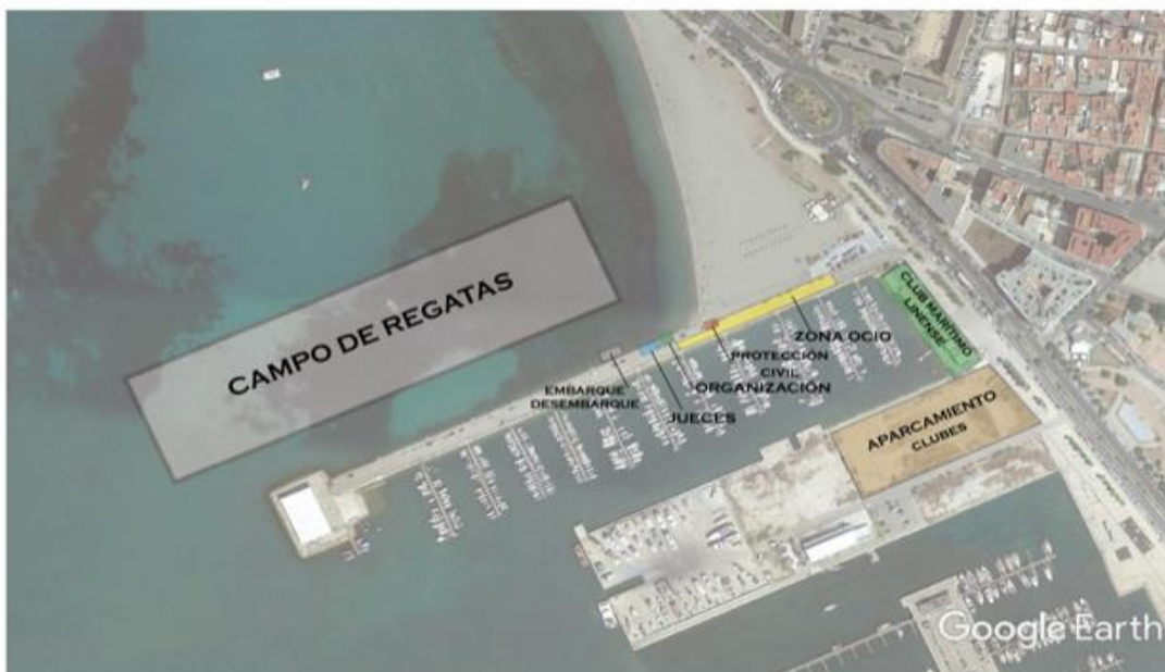
CAMPEONATO DE ESPAÑA DE BANCO FIJO LLAÜT 2018 LA LÍNEA DE LA CONCEPCIÓN