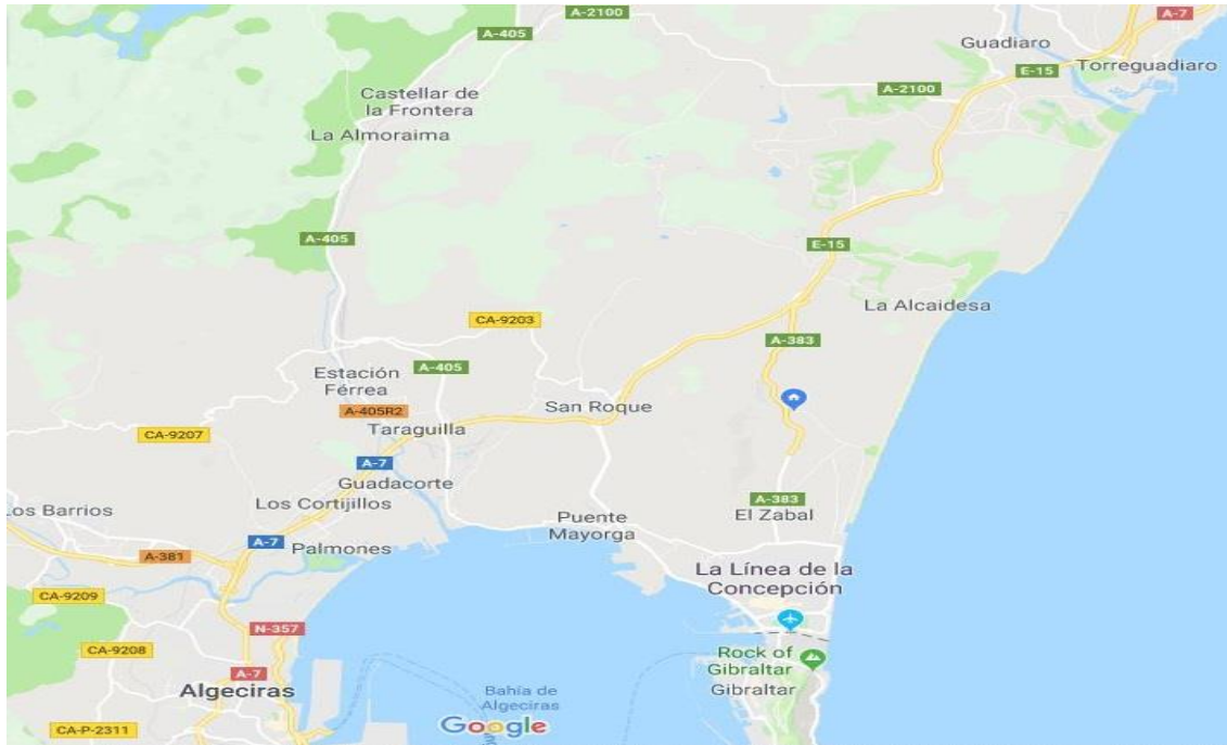
Situación de otras localidades respecto a La Línea de la Concepción