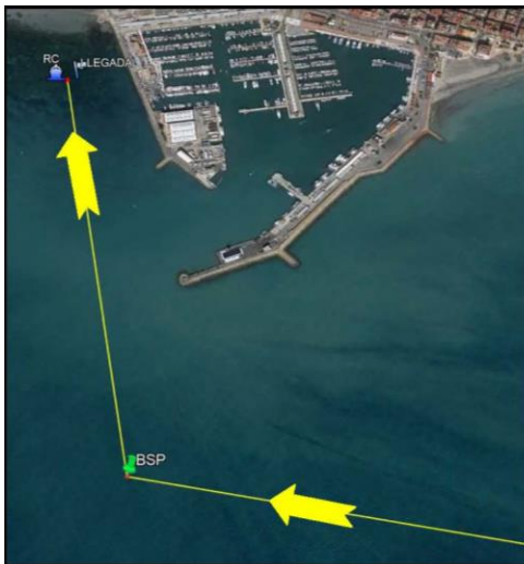
BALIZA de SEGURIDAD del PUERTO SE DEJA POR ESTRIBOR