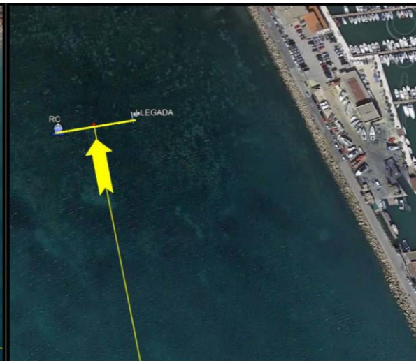
LLEGADA ENTRE BARCO DEL COMITÉ Y BALIZA DE LLEGADA