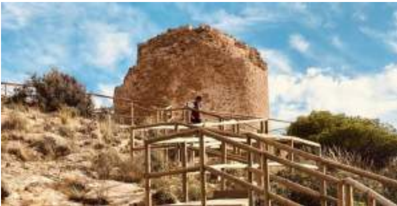
El Parque Natural de la Sierra Helada es

Aunque el tiempo ha dejado su huella, la estructura ha sido restaurada para conservar su valor histórico y permitir a los visitantes viajar en el tiempo mientras contemplan su imponente silueta.